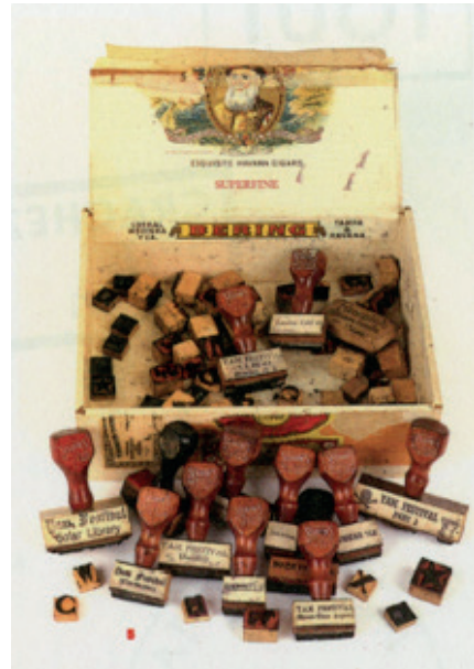
Georges Brecht, Boîte contenant les tampons du YAM Festival, 1962