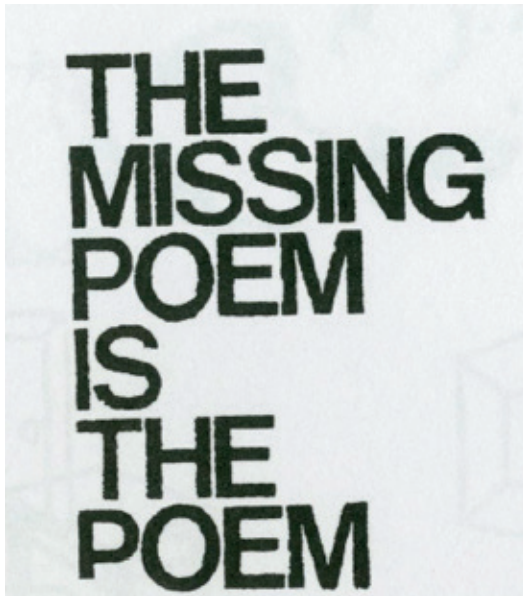
Maurizio Nannucci, The Missing Poem is the Poem, 1969