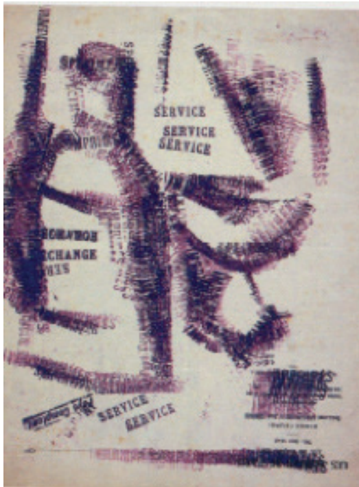
Fernand Léger, Sans titre, 1914