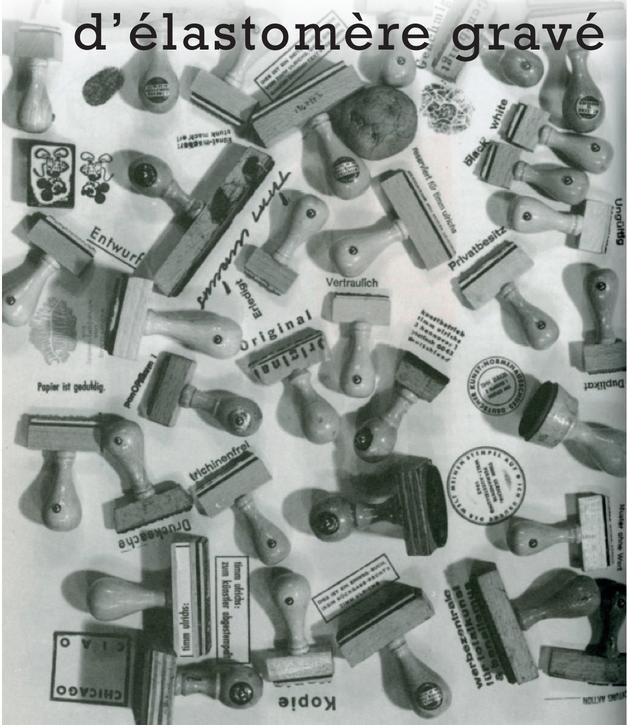
Timm Ulrichs, Assortiment de tampons , 1961-74

Une édition créée par l'association des amis du Musée cantonal des Beaux-arts (MCBA) de Lausanne en parallèle avec le nouveau MCBA