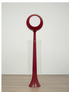
1. René Bauermeister Sphère tournante , 1968 Polyester et plexiglas 210 x 38 x 38 cm Musée cantonal des Beaux-Arts de Lausanne. Don de l'artiste, 1976.

Les autres indications (dimensions, techniques, etc.) sont souhaitées mais non obligatoires. Après parution, nous vous saurions gré de bien vouloir transmettre un exemplaire de la publication au service de presse du Musée cantonal des Beaux-Arts de Lausanne.