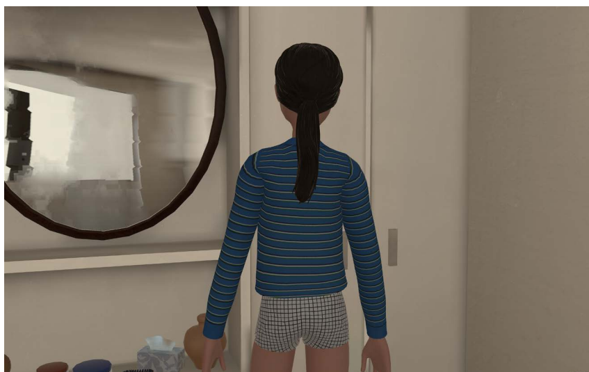
Marina Xenofontos Twice Upon a While , 2018–2025 Jeu vidéo, en boucle Courtoisie de l'artiste

Légendes des vues des salles à mentionner : Vue de l'exposition Marina Xenofontos. Play Life Musée cantonal des Beaux-Arts de Lausanne © Marina Xenofontos Photo : MCBA